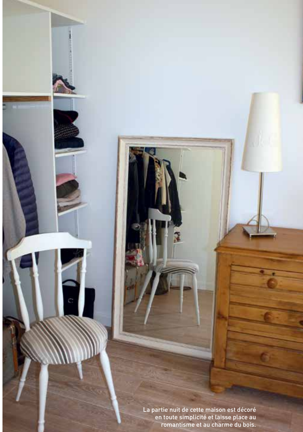
La partie nuit de cette maison est décoré en toute simplicité et laisse place au romantisme et au charme du bois.